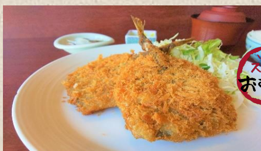
境港産 アジフライ定食