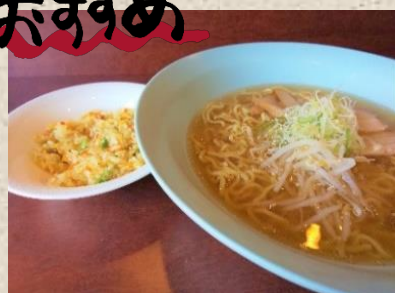
ラーメン半チャーハン